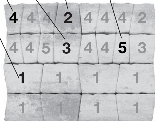
Placering på pall vid leverans.

På bilden till höger visas stenarnas placering på pall vid leverans.