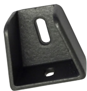
sektionsfäste x 4