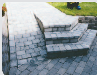
Finurlig trappa som även fungerar för skottkärra eller rullstol.