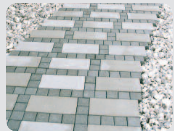
Kombinera olika stensorter.