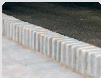
Olika lösningar på kanter.