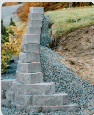
Geonät som dubbats fast med glasfiberstavar. Dubbning används endast på Keystonemurar och Garden wall.